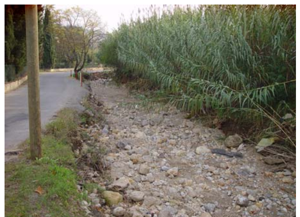
Effondrement de la berge au droit du chemin du Lac