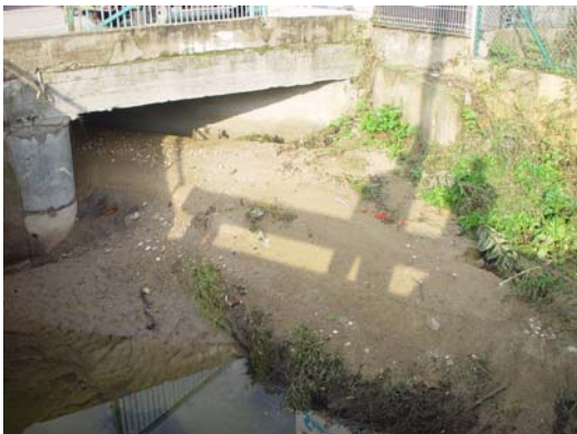
Obstruction du ponceau des Matériaux Réunis