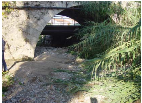
Obstruction du pont du Chemin du Lac