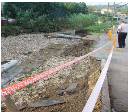
Effondrement de la berge chemin de Camperousse