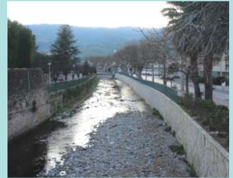
La Mourachonne à Pégomas : débordement préférentiel sur ce secteur en rive droite

Le lit du Grand Vallon, dans la traversée du Plan de Grasse, sera aménagé pour atteindre une largeur moyenne de 7 mètres. Cette nouvelle section permettra de faire passer sans débordement un débit de 50 m 3 /s. Actuellement les premières inondations sont constatées pour des débits de l'ordre de 10 à 20 m 3 /s. Globalement, sur le linéaire traversant le Plan de Grasse, trois ponts ou ponceaux représentant un obstacle pour l'écoulement vont être démontés et trois autres vont être reconstruits. Quelques bâtis tels qu'un garage ou un abris de jardin, construits sur la berge même de la rivière, vont probablement être détruits.