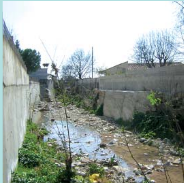
Le Grand Vallon au Plan de Grasse présente un lit fortement dégradé

Sur la base des études de définition validées par le SISA, l'entreprise choisie pour la réalisation de la mission de maîtrise d'œuvre, a rendu son document d'avant-projet au mois d'avril pour qu'il soit soumis à l'avis du SISA et des communes concernées. Il présente concrètement les solutions d'aménagements à mettre en œuvre sur le Grand Vallon et la Mourachonne. Prochainement, ce document sera soumis à une enquête publique, procédure préalable et obligatoire avant le démarrage des travaux. A cette occasion, les citoyens pourront prendre connaissance du dossier des travaux envisagés. Si le projet obtient un avis favorable, le Préfet pourra déclarer les travaux d'utilité publique et éditer un arrêté.