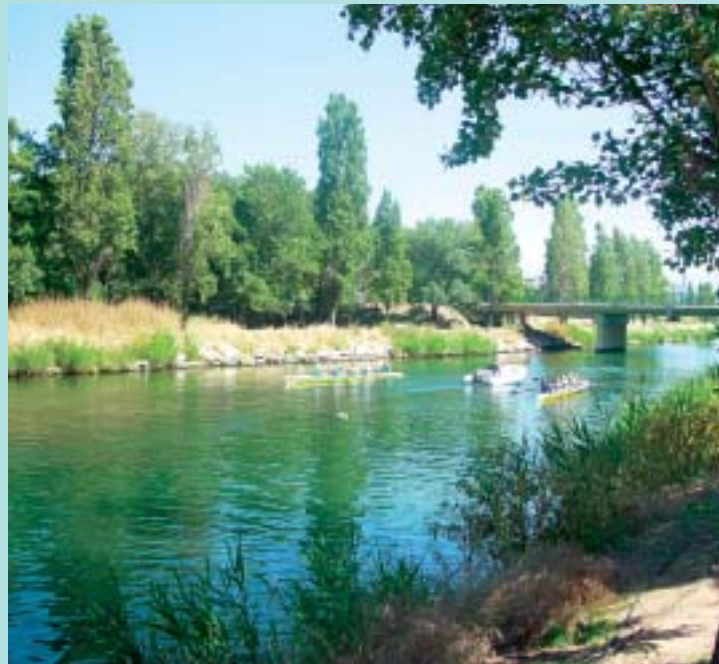
La Siagne à Mandelieu : un cadre idéal pour les loisirs

Depuis le mois d'avril, un bureau d'études est chargé de la maîtrise d'œuvre de l'aménagement de la Siagne et du Béal. Il doit définir d'ici à l'automne 2005 les types d'aménagements qui seront réalisés. Sur cette base, le SISA lancera une demande d'autorisation au Préfet pour débiter les travaux. Une enquête publique est attendue pour début 2006.