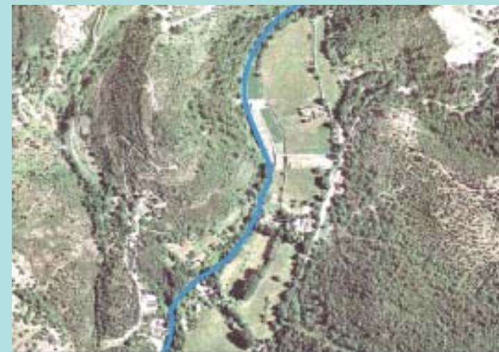
Vue aérienne de la Plaine des Cannebiens

Conformément aux directives de l'appel à projet Bachelot, un ou plusieurs bassins de rétention, d'un volume total de 90 000 m 3 , vont être mis en place sur cette plaine. Ces aménagements se rempliraient à partir d'un débit de 100 m 3 /s et permettraient ainsi une diminution des fréquences d'inondation sur la commune de Pégomas. Les solutions d'aménagement proposées tiennent compte de la volonté de la commune qui souhaite préserver cette plaine constituant un espace remarquable.